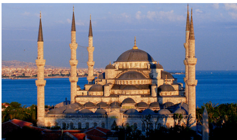
Den Blå Moské