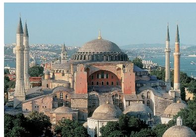
Hagia Sofie Kirken